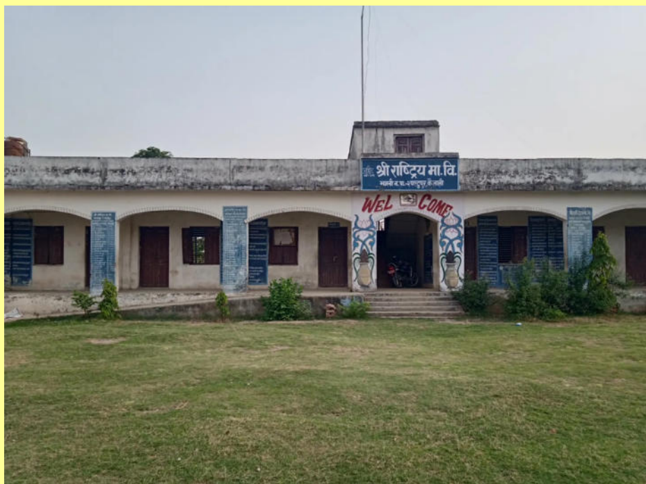
Schule in Paltapur, Nepal

Das hört sich zunächst einmal einfach an. Die Schwierigkeiten ergaben sich bei der praktischen Ausführung. Geplant war die Anlage in maximal zwei Monaten zu erstellen. Es wurden dann mehr als fünf Monate daraus. In Nepal gehen die Uhren langsamer. Die Bohrfirma war begehrt und hatte zunächst andere Aufträge abzuarbeiten. Aber auch die Bohrung war schwierig. Beim ersten Versuch gab der Bohrkopf bei zwanzig Metern den Geist auf und konnte nicht mehr an die Oberfläche geholt werden. Der Untergrund war problematisch, er bestand aus Flussteinen von bis zu 50cm Durchmesser. Bei der zweiten Bohrung wurde dann eine spezielle Tonerde eingesetzt, die die Bohrung stabilisierte und das Shreddern der Steine erleichterte. All das nahm 4 Wochen in Anspruch. Als dann das Ergebnis der Wasserproben vorlag waren wir zufrieden. Kein Arsen! Jetzt wurde nur noch ein kleines Haus für die Filter erstellt