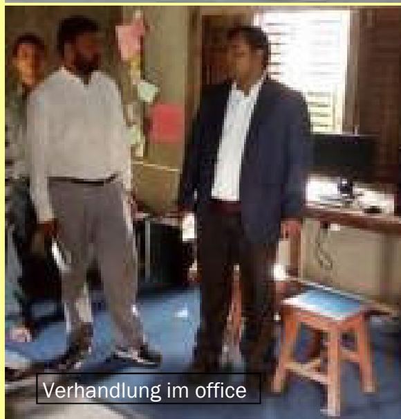
Verhandlung im office